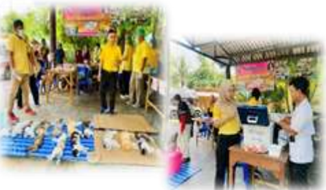
โครงการสัตว์ปลอดโรคฯ