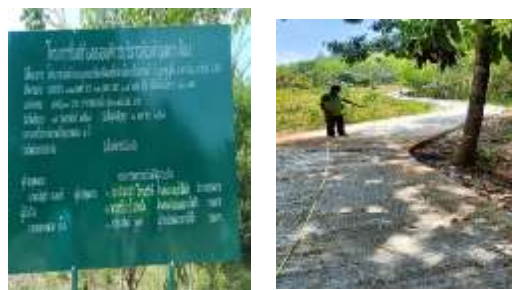
โครงการก่อสร้างถนนคสล.สายท่าเรือไปเขาตุટે๊ะฯ