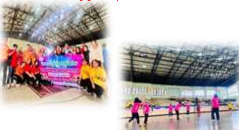
โครงการจัดส่งผู้สูงอายุเข้าร่วมการแข่งขันกีฬา