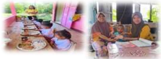
โครงการสนับสนุนค่าใช้จ่ายการบริหารสถานศึกษา