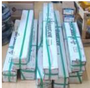
เครื่องสูบน้ำไฟฟ้าชนิดจุ่มน้ำ (submerse) ๒ แรงม้า