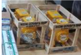
เครื่องสูบน้ำไฟฟ้าชนิดจุ่มน้ำ (submerse) ๑ แรงม้า