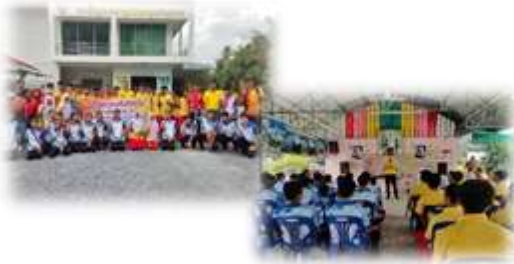
โครงการส่งเสริมกิจกรรมสภาเด็กและเยาวชน