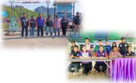
โครงการป้องกันและลดอุบัติเหตุทางถนน