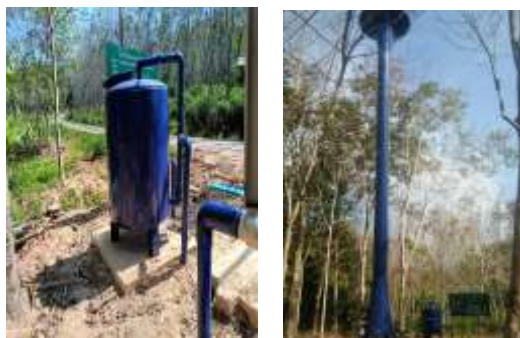
โครงการก่อสร้างหอดังประปาพร้อมขยายเขต ม.7