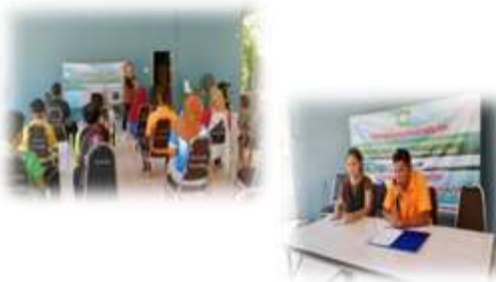
โครงการฝึกอบรมภาษาต่างประเทศ