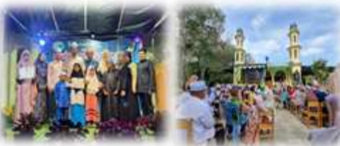
โครงการประกวดการอ่านคัมภีร์อัลกุรอานฯ