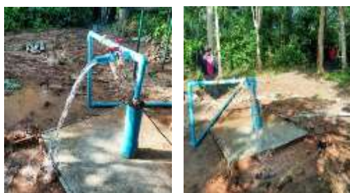
โครงการขุดเจาะบ่อบาดาลขหมูที่ 1