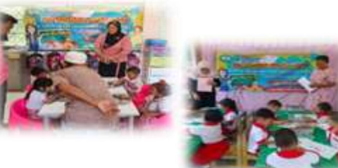
โครงการแข่งขันทักษะทางวิชาการ