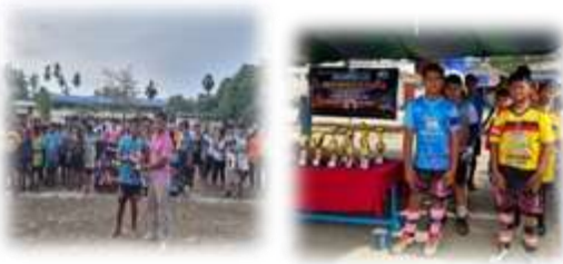
โครงการจัดการแข่งขันกีฬาเกาะมุกด์ร่วมใจ