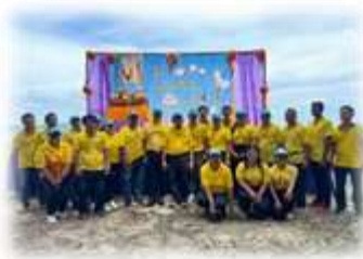
โครงการทำดีเพื่อแผ่นดิน