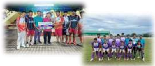
โครงการจัดส่งนักกีฬาฯ "ลอยกระทงคัพ"