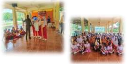
โครงการรณรงค์ป้องกันและแก้ไขปัญหายาเสพติด