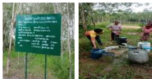
โครงการขุดเจาะบ่อบาดาลขหมูที่ 8