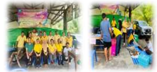
โครงการทำหมันสุนัขและแมว