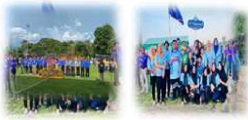
โครงการจัดส่งนักกีฬาฯ"พระยารัษฎาเกมส์"