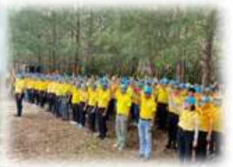
โครงการอบรมพัฒนาศักยภาพบุคลากรเพื่อเพิ่มประสิทธิภาพในการปฏิบัติงานและส่งเสริมคุณธรรมจริยธรรมในองค์กร