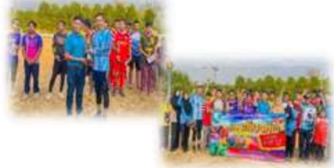
โครงการจัดการแข่งขันกีฬาเกาะลิบงคัพ